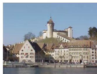
Der Munot, das Wahrzeichen von Schaffhausen